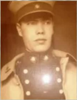
Coronel de Ejército Luis Clavel Dinator

Un 30 de marzo de 1978 nuestro fundador tuvo la visionaria iniciativa de crear una organización de oficiales superiores en retiro de las tres instituciones de las Fuerzas Armadas integrando los Cuerpos de Coroneles y Navíos creados en Santiago y Valparaíso en 1953.