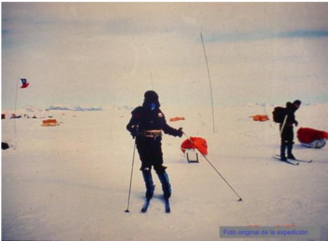
Foto original de la expedición

Fase de preparación, Mayo y Junio de 1995, se inició la selección de los integrantes, luego de exhaustivos exámenes, físicos, médicos y psicológicos, se seleccionó el equipo de