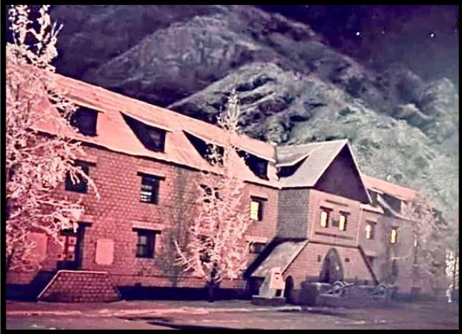
Ilustración 1 En el cuartel de Río Blanco: la cuna de los cóndores guerreros.

las 19:00 horas de la tarde de ese frío y húmedo día, regresé con el Sargento Vallejos a Los Hornos.