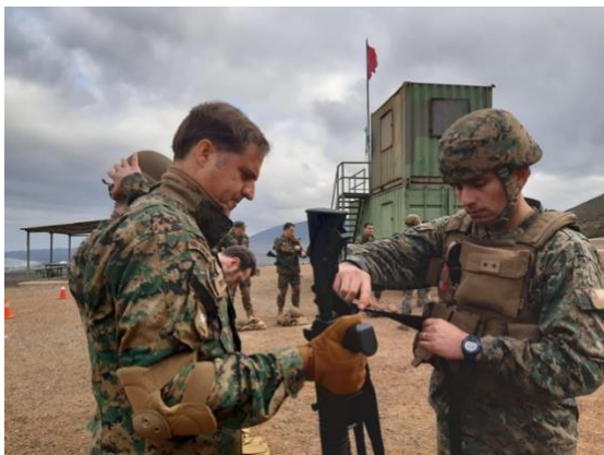
Imagen n° 2

Reservistas Regimiento N°1 "Buin", en instrucción en Pichicuy