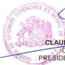
CLAUDIO IRRIBARRA LOPEZ Coronel de Ejército PRESIDENTE DEL COSURFFAA