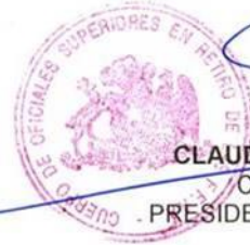
CLAUDIO IRRIBARRA LOPEZ Coronel de Ejército - PRESIDENTE DEL COSURFFAA